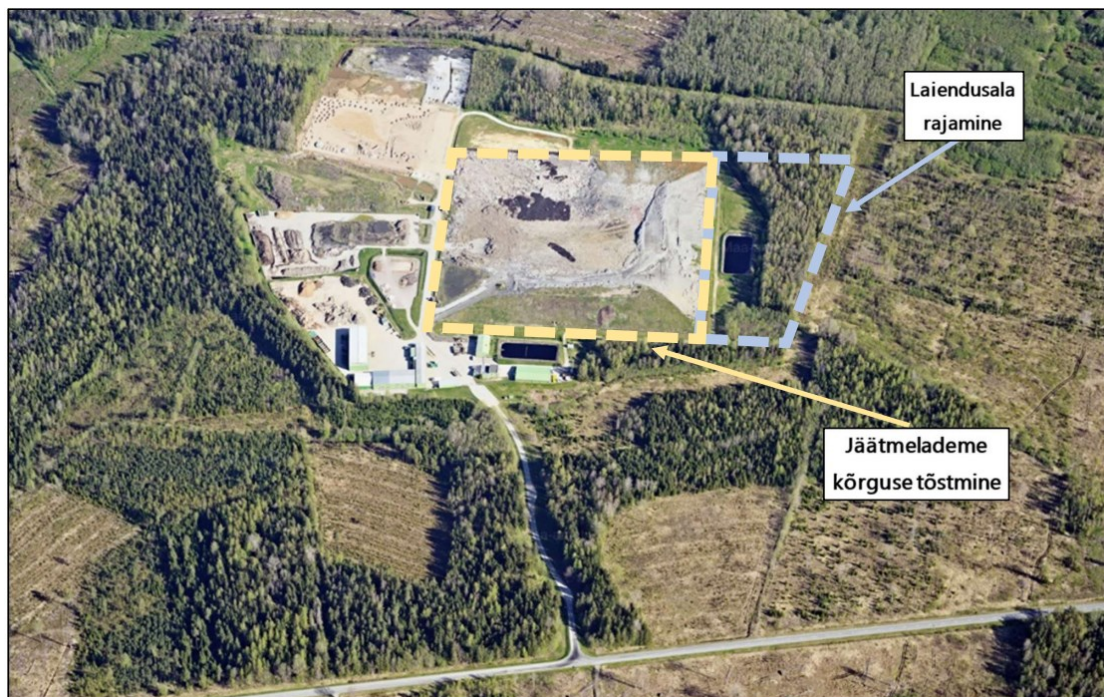
Joonis 2. Vaade Väätsa prügilale ja lähikümbrusele